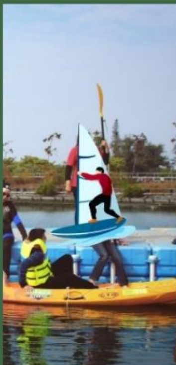
運動休閒與健康管理系